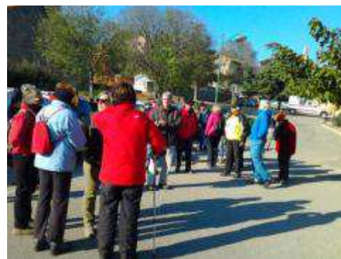
Le groupe du 27 novembre 2013