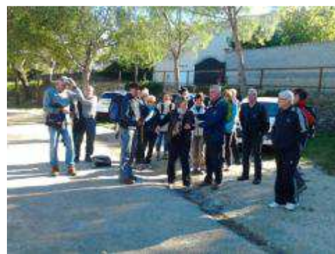
Le groupe du 14 novembre 2013