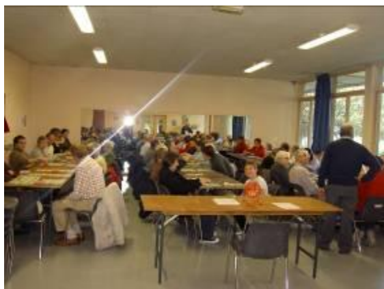
Le loto du 10 février 2008, toujours aussi apprécié...