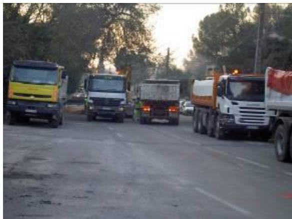
Les travaux de voirie, un embouteillage dans notre chemin.