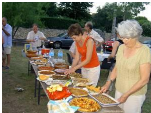
Le repas qui a suivi l'Assemblée Générale