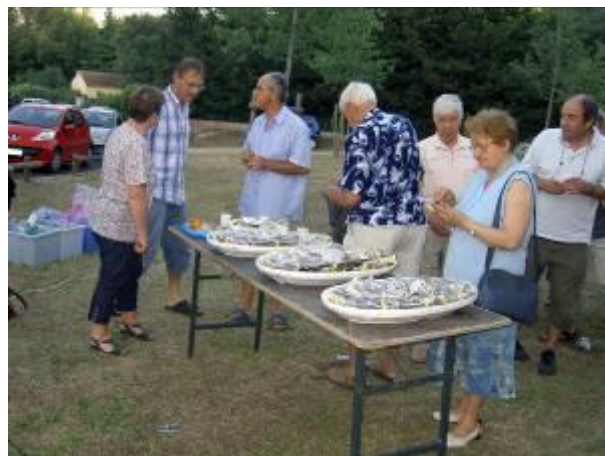
Il y a des amateurs d'huîtres à Camplanier !