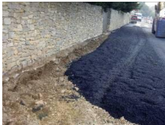
Les travaux de voirie, le goudron n'a pas été regretté !