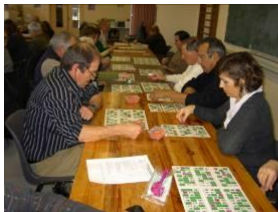
... Et toujours suivi avec sérieux !